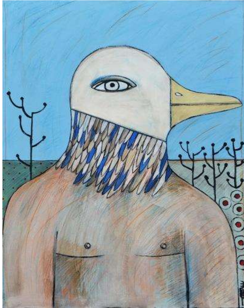
L'homme oiseau - Martine Littot (2017)