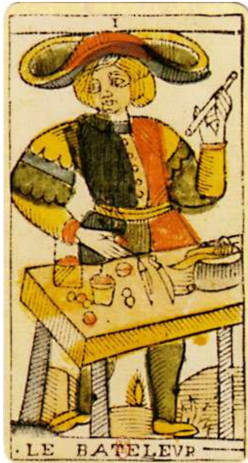
Le Bateleur de Jean Dodal (XVIIIe siècle)