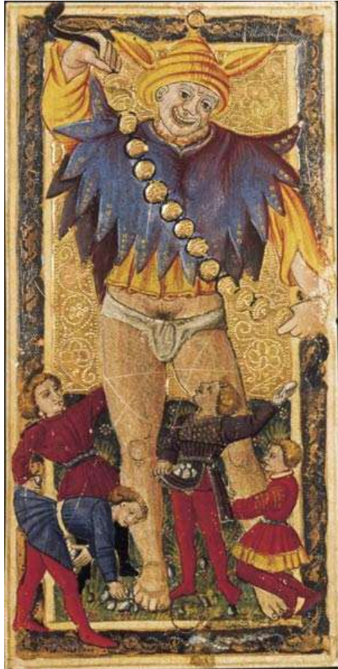
Le fol, tarot dit de Charles VI, peint par Jacquemin Gringonneur (vers 1392)